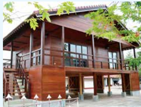
モデルハウス完成

ラオスは持続的な森林開発を目指す中で、木材供給に見合う加工業の育成や木材利用促進による低所得者層の住環境の改善が課題となっています。同社は現地の職業訓練校と連携し、プレカット工法を用いた木材加工・木造建築技術の普及により、ラオス人技術者育成を通じた雇用創出および木造建築産業の育成に取り組んでいます。現地技術者や関連業者との協業により、プレカット構造材や木材加工製品の販売展開を目指しています。