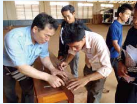
職業訓練校での技術指導の様子