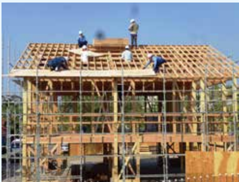
パクセー市内でモデルハウスを建築している様子